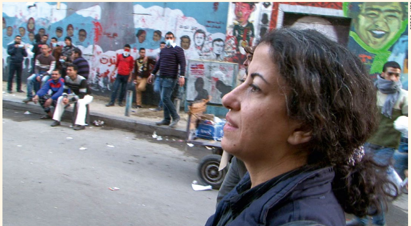
The Trace of the Butterfly

Auch in Otok ljubavi („Liebesinsel“, HR/BIH 2014) von Jasmila Žbanić taucht unerwartet eine Ex-Geliebte der Protagonistin auf. Die Konfrontation mit der Vergangenheit zwingt die hochschwängere Liliane dazu, ihre derzeitige Beziehung zu überdenken. Und ihr Machomann Grebo sieht sich mit sexuellen Herausforderungen konfrontiert, die er bisher für undenkbar gehalten hatte. Im Gegensatz zu July Jungs Film droht hier jedoch keine Katastrophe hereinzubrechen, sondern es entfaltet sich eine klamaukhafte und unterhaltsame Regenbogenutopie, in der sich am Ende die touristische Einwohnerschaft der Insel in Musik, Tanz, Liebe und Harmonie vereint.