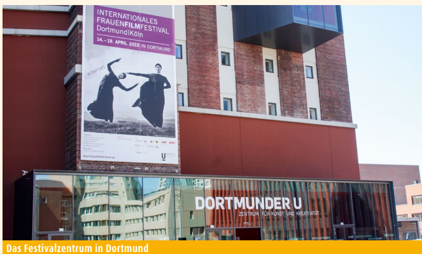
Das Festivalzentrum in Dortmund

fortzonen verlassen, um laut Jury „die Stärke und Brüchigkeit des Lebens“ zu erforschen. Dabei geht es um familiäre Dramen, Verlust des Vaters, sterbende Mutter, Trauer und Abschied, aber auch Naturverbundenheit, Sexualität und Spiritualität. Naomi Kawase selbst wünscht sich, dass den „Zuschauern des Films klar wird, dass wir Menschen nicht der Nabel der Welt sind“ und „dass dieser Kreislauf, in dem wir alle leben, von göttlicher Natur ist“.