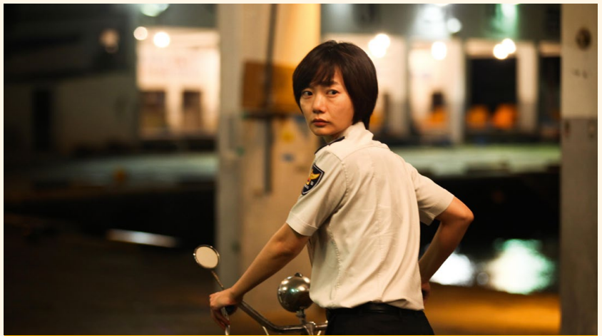
A Girl at My Door